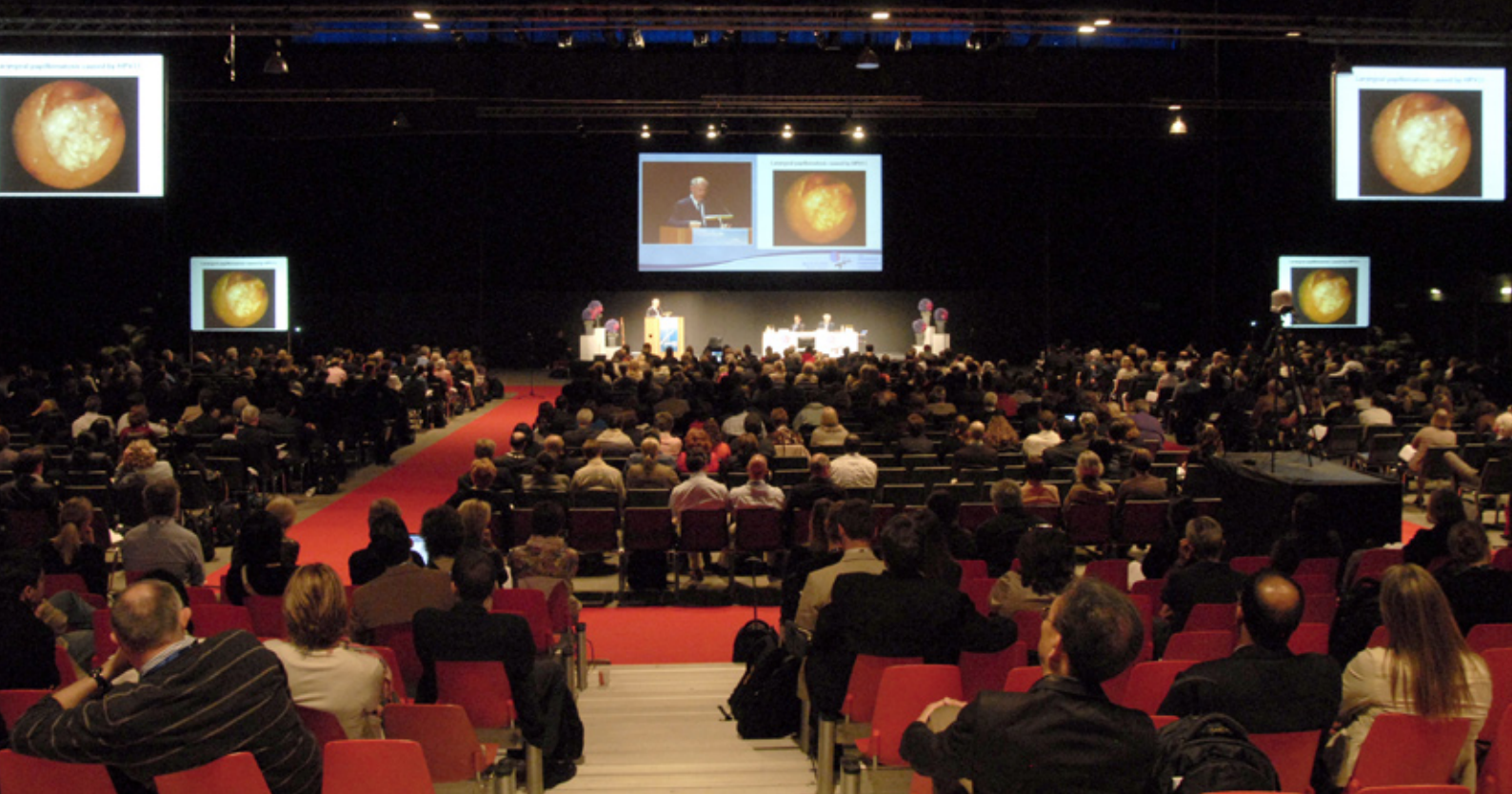
The 25th International Papillomavirus Conference May 8-14 2009, Malmö